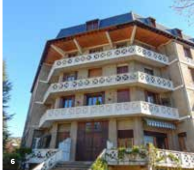
6. Ancien Grand Hôtel, Mende